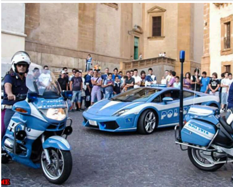
Секс-скандал в італійському футболі: зірок Серії А підозрюють у користуванні послугами підпільної ескорт-мережі

В Італії розкрито схему з участю гравців Серії А, яких підозрюють у використанні ескорт-послуг через мережу закритих подій. За даними розслідування, у справі задіяні десятки атлетів, зокрема з провідних клубів, а також ситуації, пов'язані з вагітністю однієї з дівчат.