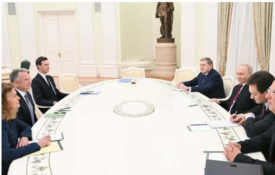
Через перемир'я в Ірані тристоронні переговори щодо України можуть відновитися, вважають у Москві

Москва запевняє, що не буде перешкоджати переговорному процесу, але наголошує, що подальший розвиток подій залежить від кроків Вашингтона у відносинах з Іраном.