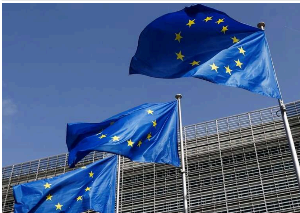
Євросоюз не зміг домовитися про призупинення угоди з Ізраїлем через позицію Німеччини, - Reuters

Держави Євросоюзу не досягли згоди щодо призупинення асоціативної угоди з Ізраїлем, попри пропозиції кількох країн посилити заходи стосовно Єрусалима.