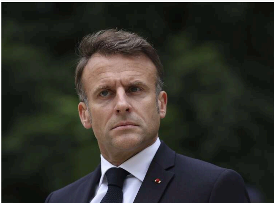
Макрон погрожує розірвати угоду про асоціацію з Ізраїлем через Газу та Ліван