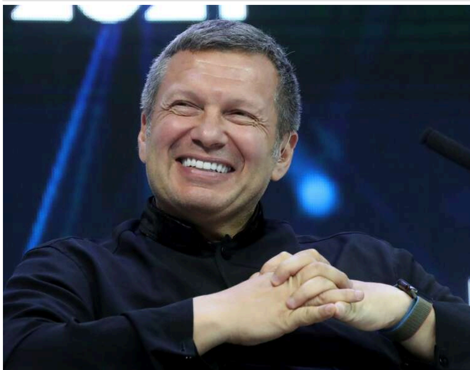
Дипломатичний скандал: Італія викликала російського посла через образи Соловйова на адресу Джорджи Мелоні

Російський телеведучий Володимир Соловйов, відомий своїми різкими й часто відверто образливими висловлюваннями на адресу європейських політиків, не на жарт обурив італійців.