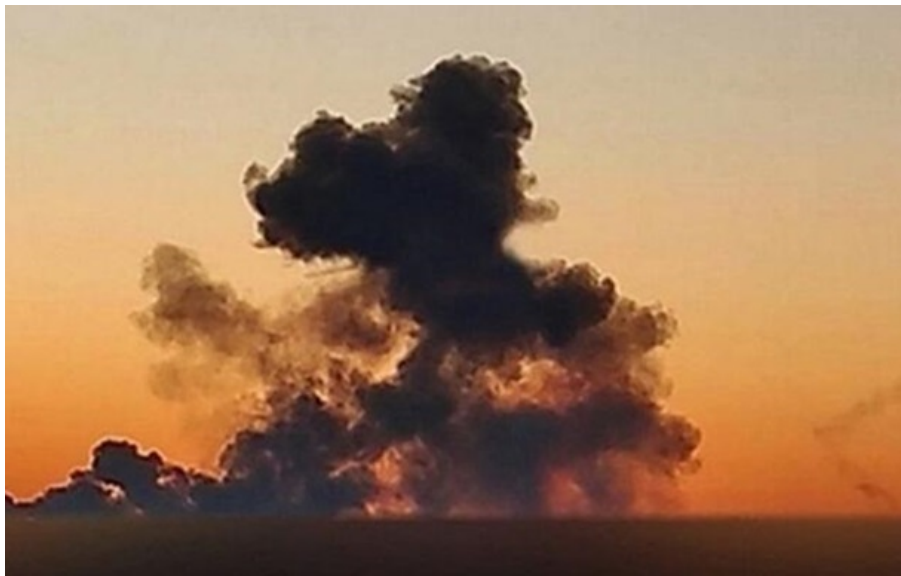
Фото: Фото з відкритих джерел (ілюстративне фото)

Під ударом могла опинитися військова авіабаза в районі міста Кримськ Краснодарського краю РФ