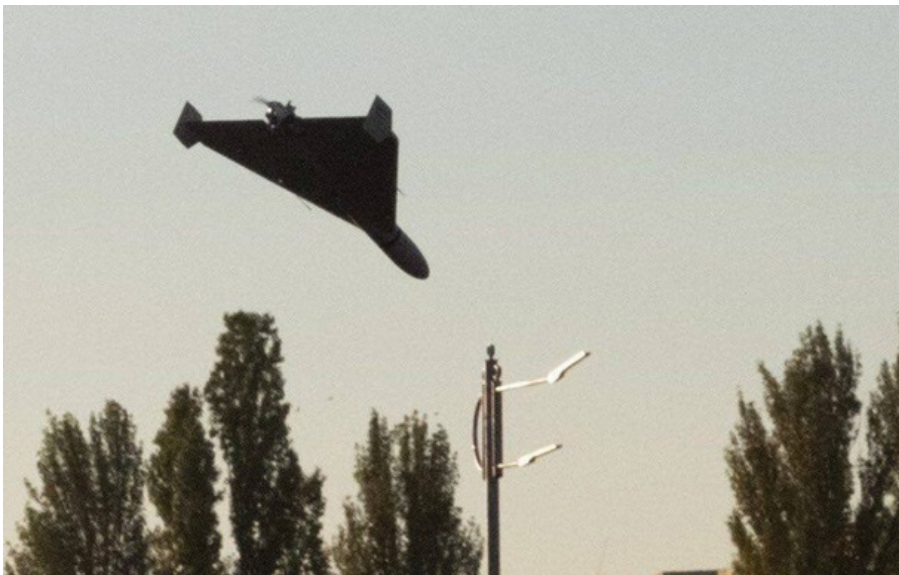
Фото: Соцмережі (ілюстративне фото) Враг нанес удар боевым дроном по Шевченковскому району Харькова