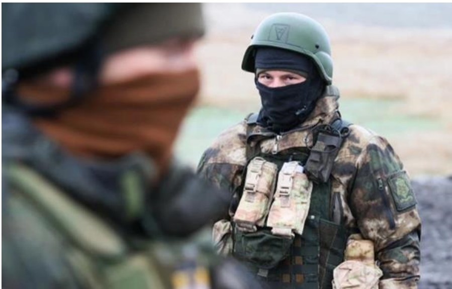
Фото: Російські ЗМІ (ілюстративне фото) Росіяни змогли просунути у Харківській та Донецькій областях