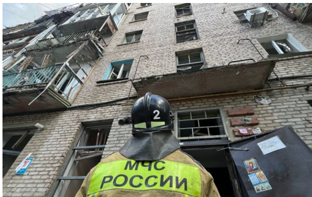
Фото: російські рятувальники працюють на місці влучання (t.me/mchc_official)

У ніч на 22 квітня безпілотники атакували російське місто Сизрань у Самарській області.