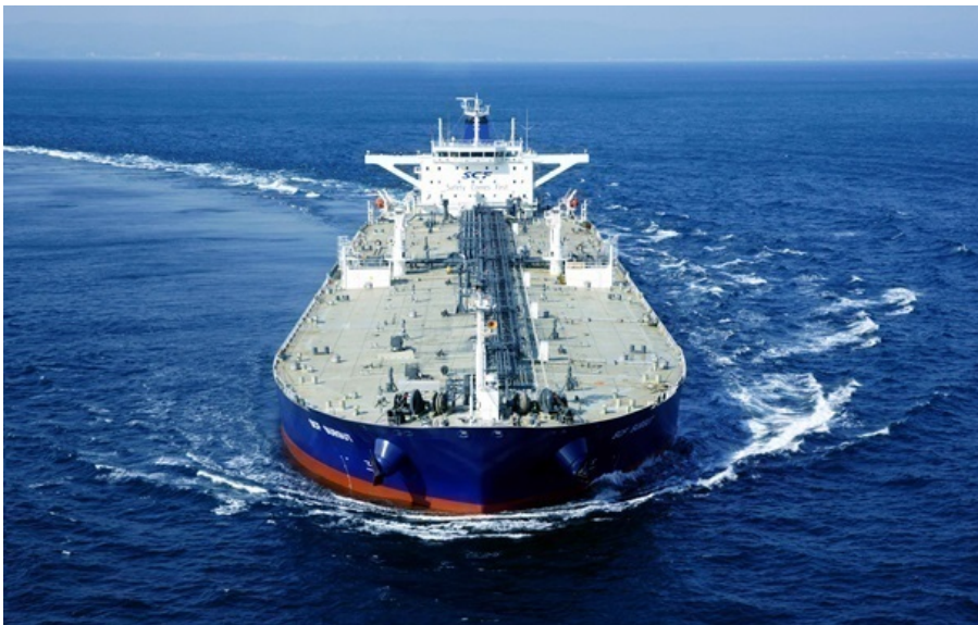
Фото: Совкомфлот (ілюстративне фото) РФ збільшила доходи від нафти до найвищого рівня з 2022 року

Середній валовий дохід Росії від експорту нафти піднявся до $2,02 млрд на тиждень, тоді як у березні він становив $1,79 млрд.