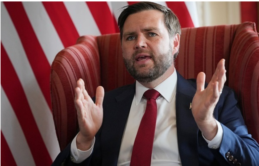
Віцепрезидент США Джей Ді Венс