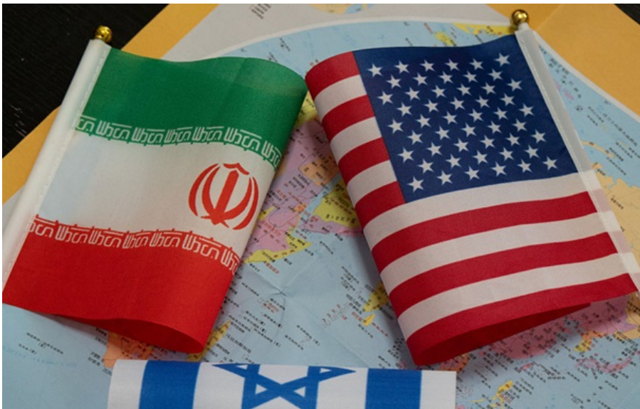
Мир між США і Іраном зривається