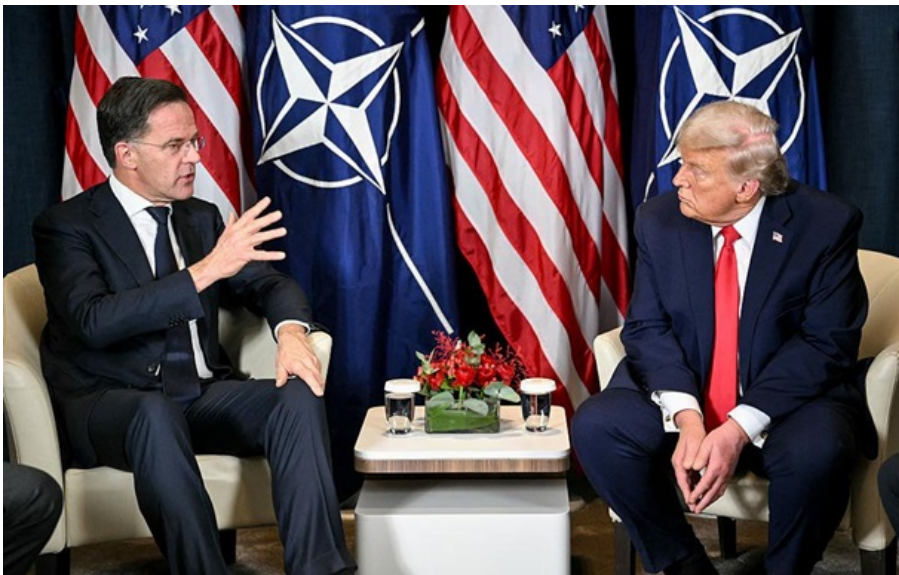
Зустріч Трампа та Рютте пройде 8 квітня

Трамп після зустрічі з Рютте, що відбудеться 8 квітня, може надати коментарі з цього приводу, зазначила Керолайн Левітт.