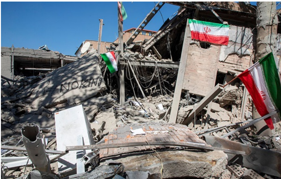
Посол Ірану при ООН Алі Бахреїні заявив, що Тегеран не довіряє Вашингтону

Президент Ірану підтвердив участь своєї країни, в той час як США не надали офіційної відповіді.