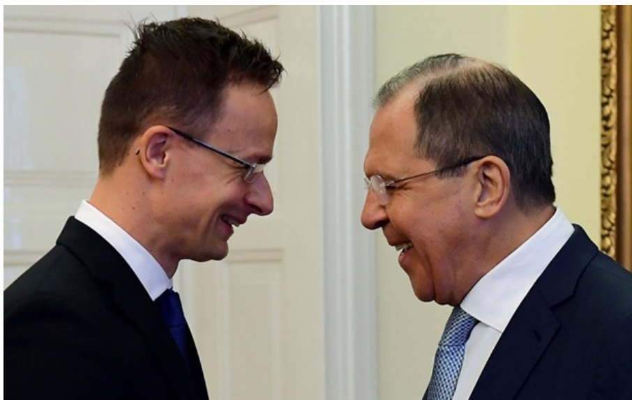
Записи розмов охоплюють 2023-2025 роки, їхню автентичність підтвердили кілька розслідувальних журналістських проєктів

👍 0 🐦 0 🗨️ 1 👁️ 3943 ЧИТАТИ НОВИНУ РОСІЙСЬКОЮ